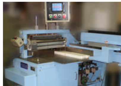
■ NCローダ付(オプション)