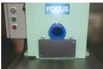
開口部に人手で挿入しブラシに突き当てます。